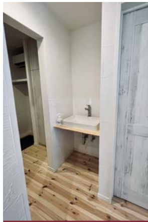
●帰宅してすぐ手洗い！ 玄関横の洗面カウンター