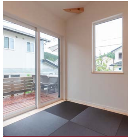
●くつろぎの畳コーナーから繋がる ウッドデッキ