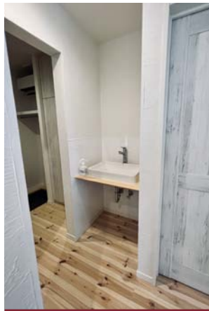
●帰宅してすぐ手洗い！ 玄関横の洗面カウンター