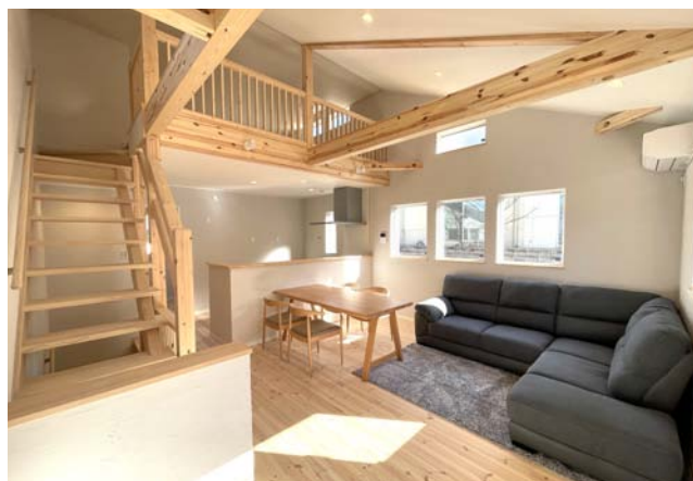
●プライバシーが守られる明るい2Fリビング