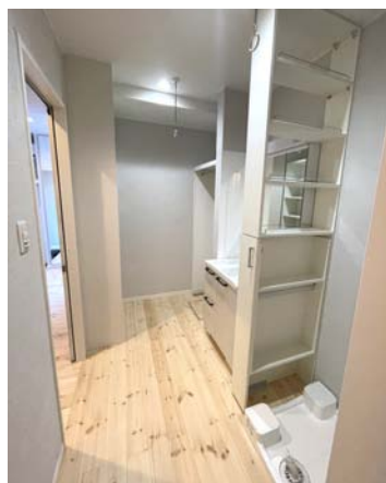
●洗面・浴室・ウォークイン クローゼットが並ぶ 使いやすい動線プラン