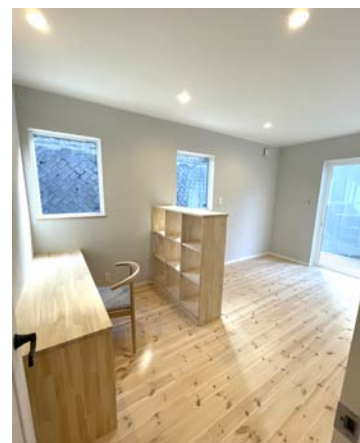
●リモートワークにぴったりの ライブラリコーナー