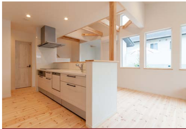
●1F リビングでもしっかりプライバシーが守れる 明るいLDK！

1F リビングのお家と 2F リビングのお家、タイプの異なる2邸を「松ヶ崎ショールーム」を起点に90分でぐるっと回って見学します！