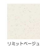
リミットベージュ