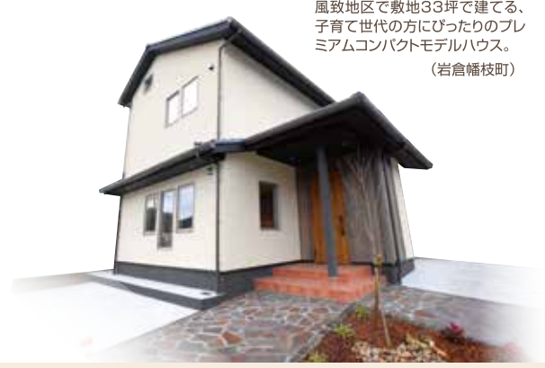
風致地区で敷地33坪で建てる、子育て世代の方にぴったりのプレミアムコンパクトモデルハウス。 (岩倉幡枝町)