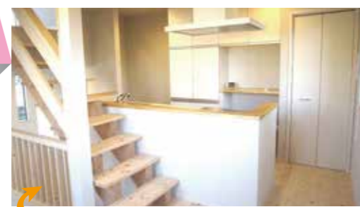
こちらのお家は、4月20日(月)までの限定公開です。